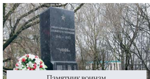
Памятник воинам села Федосьино, павшим в Великой Отечественной войне (ул. Федосьино, д. 20)