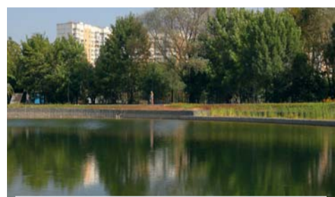
Сквер у Малого Федосьинского пруда (Федосьино ул., д. 16, к. 3)