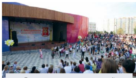
Открытая сцена с всесезонной эстрадой (ул. Лукинская, д. 12, к. 1)