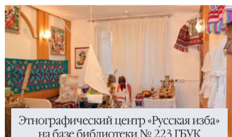
Этнографический центр «Русская изба» на базе библиотеки № 223 ГБУК г. Москвы «ЦБС ЗАО» (ул. Новопеределкинская, д. 8)