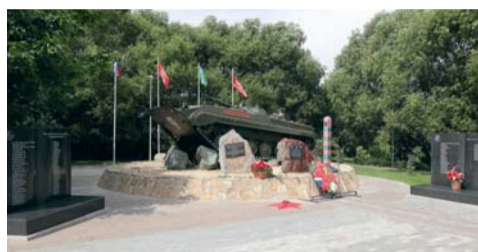
Мемориал погибшим при исполнении воинского долга (ул. Лукинская, вл. 20)

ГАЗЕТА МЕСТНОГО САМОУПРАВЛЕНИЯ МУНИЦИПАЛЬНОГО ОКРУГА НОВО-ПЕРЕДЕЛКИНО В ГОРОДЕ МОСКВЕ