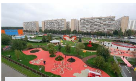
Детский парк «Буратино» (ул. Новоролвская, вл. 5)