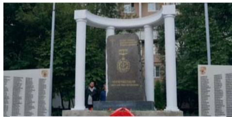
Памятник «Чернобыльцам – жителям Ново-Переделкино» в сквере «Героев Чернобыльцев» (ул. Шолохова, д. 6)