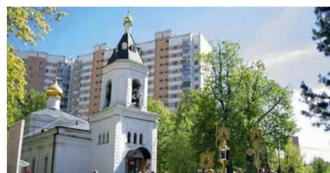
Храм Благовещения Пресвятой Богородицы в Федосьино (ул. Лукинская, д. 11, к. 1)