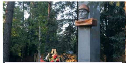
Памятник жителям села Чоботы, погибшим на фронтах Второй Мировой войны (9-я Чоботовская аллея, д. 18)