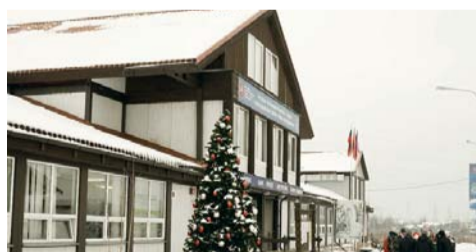
ГБУ СШОР «РПС-Столица» Москомспорта, СК «Ново-Переделкино» (Проектируемый проезд, № 635, д. 9, к. 1)