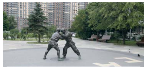
Сквер «Борец» и скульптура Зураба Церетели «Дети-борцы» (Боровское шоссе, д. 33)