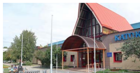
ГБУ «Спортивная школа олимпийского резерва №7» Москомспорта (ул. Чоботовская, д. 4)