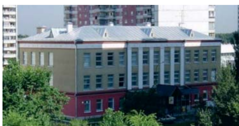
ГБУ «СШ «Борец» Москомспорта (Боровское шоссе, д. 37, к. 1)