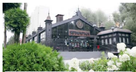
Межрегиональная ярмарка (Чоботовская ул., вл. 1)