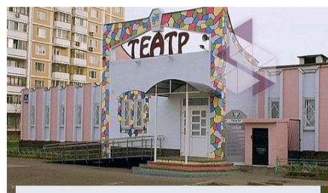
Московский театр «Переделкино» (Боровское шоссе, д. 35, к. 1)